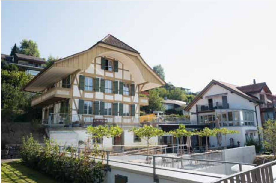
Stöckli und Westansicht Doppel-Einfamilienhaus