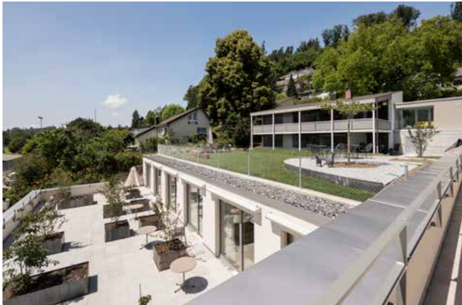
Aussensitzplätze zu Pflegezimmer