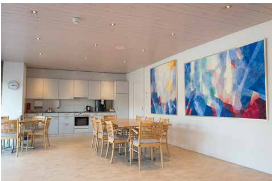
Loggia Stöckli UG